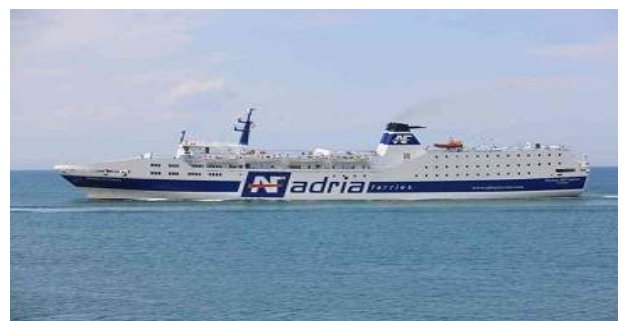
Fährschiff Dürres - Ancona